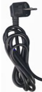
AC-virtajohto (tilattava erikseen)

Pistokevaihtoehdot: Eurooppa: CEE 7/7 UK: BS 1363 Australia/New Zealand: AS/NZS 3112