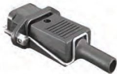
Pidäkejousi (mukana toimituksessa)