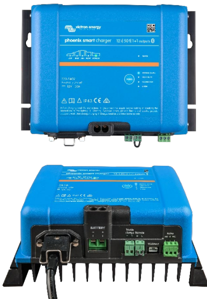
Smart IP43 Charger 12/50(1+1)