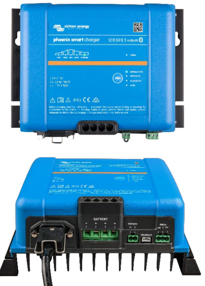
Smart IP43 Charger 12/50(3)