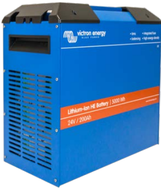
24V/200Ah HE - akku