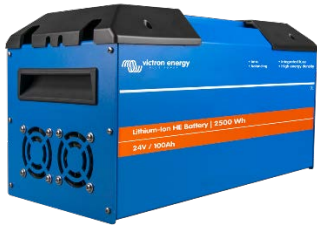
24V/100Ah HE - akku